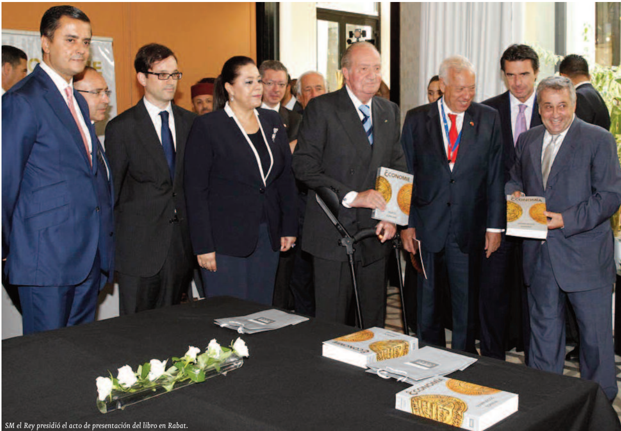
SM el Rey presidió el acto de presentación del libro en Rabat.

Primavera Árabe. A ello se suma, la privilegiada relación que mantiene Rabat con la UE. Marruecos es, en efecto, el único país socio al que se le ha concedido el “estatuto avanzado”, y el primer país del área mediterránea en iniciar el proceso de negociaciones para alcanzar un acuerdo de libre comercio con Bruselas. Por otro lado y frente a la atonía de la española, la economía marroquí ha dado señales de un extraordinario dinamismo con tasas medias de crecimiento de su PIB a lo largo de los últimos diez años superiores al 4,5%, aun cuando Marruecos no haya permanecido ajeno a la crisis mundial y en especial a las dificultades de la UE, su principal socio económico y comercial. No hay por otro lado sector en Marruecos que no se haya dotado de un plan estratégico para impulsar su desarrollo, evidenciando con ello importantes oportunidades de negocio, en ámbitos tan dispares como el agrícola-