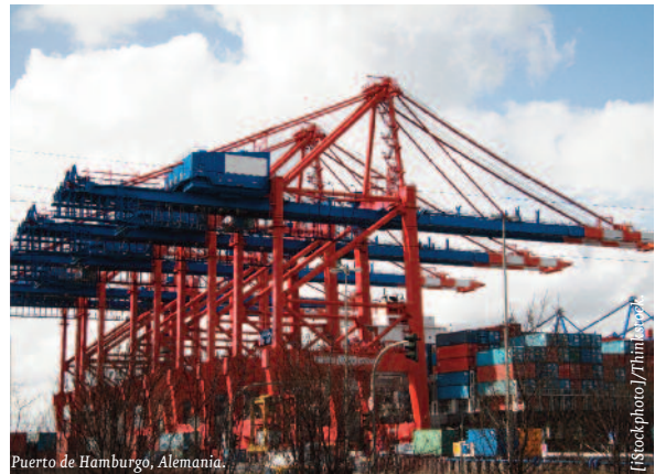
Puerto de Hamburgo, Alemania.

Las garantías a primer requerimiento, en cambio, se refieren a operaciones independientes de los contra-