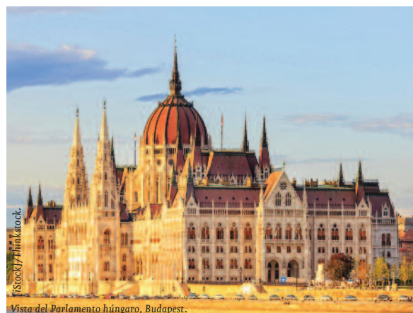
Vista del Parlamento húngaro, Budapest.

En materia de política exterior, la reforma constitucional ha sido fuente de polémica desde principios de 2012, ante las dudas suscitadas en Bruselas sobre cómo el país ejerce su democracia y pone en