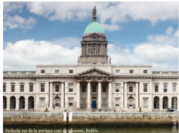
Fachada sur de la antigua casa de aduanas, Dublín.

Las próximas elecciones parlamentarias (que se celebran cada cinco años) están previstas para principios de 2016. Los principales partidos de la oposición