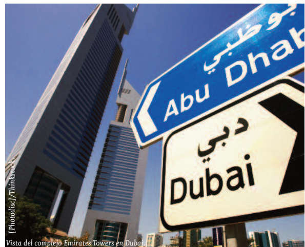
Vista del complejo Emirates Towers en Dubái.

Los Emiratos Árabes Unidos se configuran como una federación de siete emiratos constituida en 1971. El sistema federal constitucional de gobierno está constituido por el Consejo Supremo Federal, un Consejo de Ministros, un Consejo Nacional Federal y un Tribunal Supremo. El primero de ellos elige al Presidente y Vicepresidente de EAU por un mandato de cinco años renovables, aprueba el nombramiento del primer ministro (a propuesta del presidente) y ratifica leyes y decretos federales. El actual presidente es el Sheikh Khalifa bin Zayed Al Nahyan, emir de Abu Dabi, y el cargo de primer ministro lo ocupa el Sheik Mohammed bin Rashid Al Maktoum, también gobernante de Dubái. Ambos lideran un gobierno que se desarrolla en un clima de estabilidad, alterado discretamente por las demandas de mayor pluralidad política por parte, sobre todo, de los emiratos del norte, que tienen menos recursos. En este sentido, conviene recordar que los partidos políticos no están permitidos, así como tampoco las organizaciones de carácter sindical; en cambio, sí se permiten asociaciones de asistencia o de interés cultural y las de «hombres de negocios».