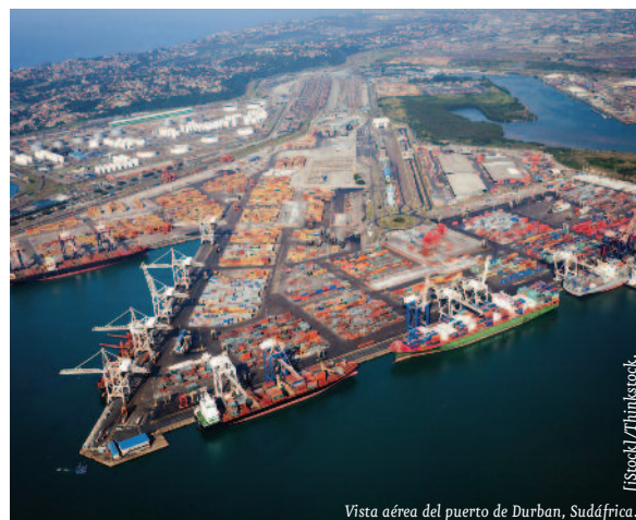
Vista aérea del puerto de Durban, Sudáfrica.

En el plano internacional, Sudáfrica, como país más desarrollado de la región africana, continúa desempeñando un importante papel en las re-