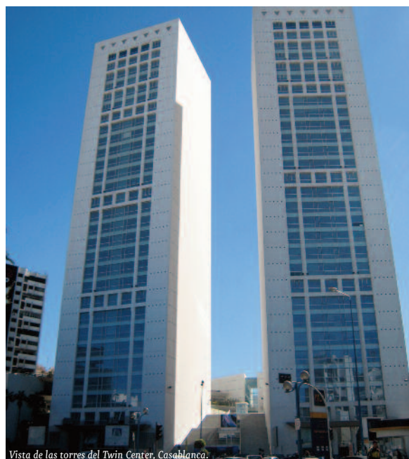
Vista de las torres del Twin Center, Casablanca.

Una de las principales novedades que inspiran el nuevo decreto es la unicidad del marco jurídico aplicable a la contratación pública. El decreto anterior definía únicamente las modalidades de contratación con el Estado (los ministerios y sus departamentos). El resto de las entidades públicas (establecimientos públicos, colectividades territoriales) tenían, para sus licitaciones, sus propios reglamentos que remitían a una multitud de textos legales y reglamentarios. Efectivamente, no existía la posibilidad para