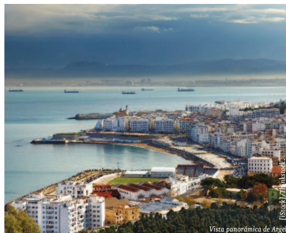
Vista panorámica de Argel.

El actual Gobierno argelino está apostando por la diversificación de la economía, si bien, la débil situación económica que ha llevado al aumento de la inflación y del desempleo, la falta de oportunidades para los jóvenes y la poca eficacia de las medidas sociales y económicas emprendidas, provocaron un contagio de las revueltas sociales acaecidas en otros países árabes. Para contrarrestarlas, el gobierno se vio obligado a anunciar la puesta en marcha de un plan de reformas políticas focalizadas en la creación de oportunidades en actividades productivas, y en un mayor grado de de-