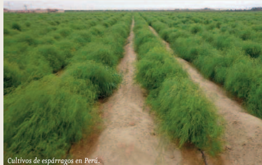
Cultivos de espárragos en Perú.

CIDACOS es una empresa familiar de Autol (La Rioja) cuyos orígenes se remontan a 1940. Desde su inicio, se dedica a la fabricación y comercialización de conservas vegetales. Para ampliar mercados inició un proceso de expansión en el mercado español en 1969, y en 1999 comenzó su expansión internacional en China, llegando a comercializar sus productos en más de 44 países diferentes.