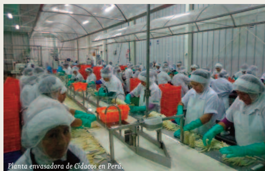
Planta envasadora de Cidacos en Perú.

CIDACOS es una empresa familiar de Autol (La Rioja) cuyos orígenes se remontan a 1940. Desde su inicio, se dedica a la fabricación y comercialización de conservas vegetales. Para ampliar mercados inició un proceso de expansión en el mercado español en 1969, y en 1999 comenzó su expansión internacional en China, llegando a comercializar sus productos en más de 44 países diferentes.