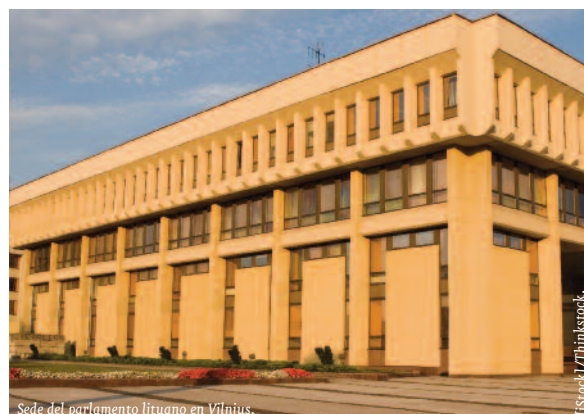
Sede del parlamento lituano en Vilnius.

Otra de las prioridades de Lituania durante la presidencia del Consejo de la UE viene dada por las relaciones del bloque comunitario con los veci-