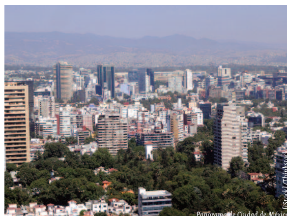
Panorama de la Ciudad de México.

Con la finalidad de impulsar de forma eficaz la implementación de esas reformas fundamentales y contar con el respaldo de las principales fuerzas políticas del país, se firmó en diciembre de 2012 el denominado Pacto por México , un acuerdo suscrito por el PRI y los dos principales partidos de la oposición: