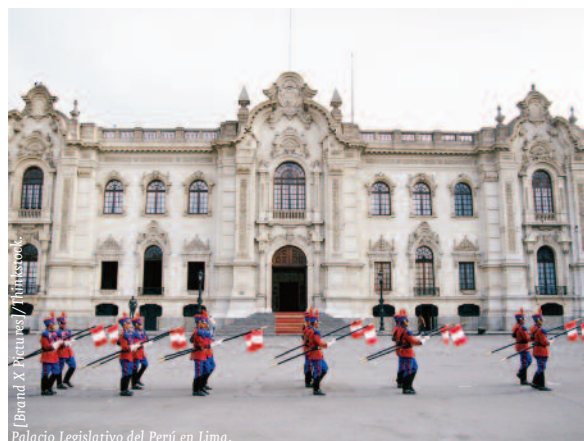
Palacio Legislativo del Perú en Lima.

No obstante, el entorno para hacer negocios presenta algunas carencias relevantes, en especial en materia judicial y en el grado de protección de los derechos de la propiedad, por lo que, de acuerdo con la clasificación del Informe Doing Business 2013 , Perú se posicionaría en el puesto 43 de entre 183 economías en cuanto a la facilidad para hacer negocios. Pese a que ha mantenido ese puesto respecto a la anterior edición, ha mejorado notablemente su posición relativa en materia de tramitación de permisos de construcción, en un en-