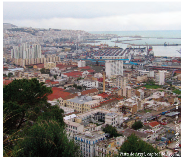
Vista de Argel, capital de Argelia.

El anciano presidente Abdelaziz Bouteflika, que disfruta de su tercer y consecutivo mandato, cuenta desde el pasado septiembre con Abdelmalek Sellal como primer ministro, quien al igual que hicieran sus predecesores con limitado éxito, manifestó que dedicaría esfuerzos a mejorar los servicios públicos, la disponibilidad de viviendas y a la creación de empleo. Y es que la elevada tasa de desempleo juvenil, las limitaciones a la expresión política, la percepción de corrupción, junto con el creciente malestar de la población con una clase política que