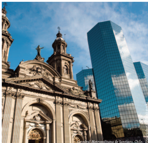
Catedral Metropolitana de Santiago, Chile.

La economía chilena no ha sido de las que más se ha resentido con la crisis financiera internacional. La solidez macroeconómica permitió a Chile hacer frente a la tormenta y sus bases económicas resistieron sin vacilar, como sí lo hicieran en crisis pasadas (crisis latinoamericana de deuda externa de 1982 o crisis asiática de 1998). Ésta vez, el país ha estado bien preparado: el sistema financiero se encuentra hoy en día dotado de una mejor regulación y supervisión, las exportaciones son hoy más diversifi-