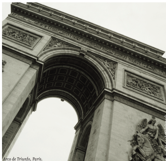
Arco de Triunfo, París.

El mejor comportamiento mostrado por la economía gala responde a varios factores. Por un lado, el importante papel que desempeña el gasto público y la protección social en el país han contribuido a amortiguar los efectos económicos de la crisis sobre la población. Por otro lado, algunos economistas (como Guillaume Duval) sugieren que el ritmo de destrucción de empleo ha sido menor en Francia que en otros países europeos gracias, y paradójicamente, a las controvertidas “35 horas” introducidas por la “ley Aubry” (la cual permitió reducir la jornada de trabajo a 35 horas semanales, y que ha sido modulada por dos leyes posteriores de 2007 y 2008), que ha-