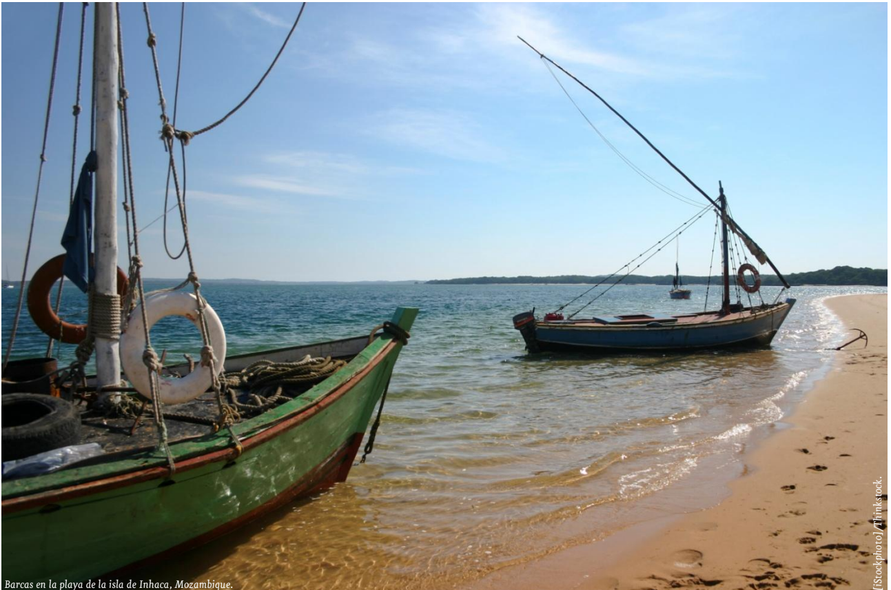
Barcas en la playa de la isla de Inhaca, Mozambique.