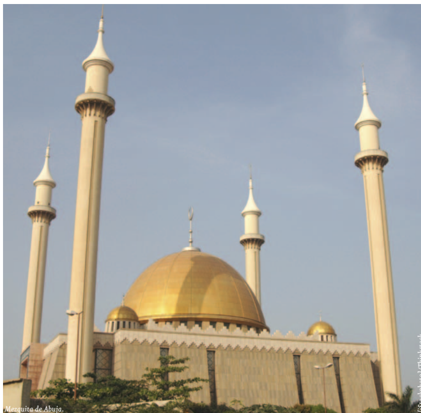
Mezzquita de Abuja.

La balanza comercial hispano-nigeriana se caracteriza por un desequilibrio que tradicionalmente ha arrojado un saldo negativo para España; en los 11 primeros