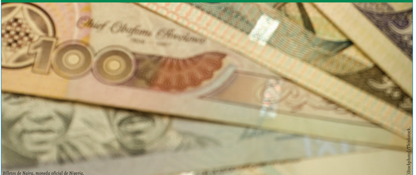
Billetes de Naira, moneda oficial de Nigeria.