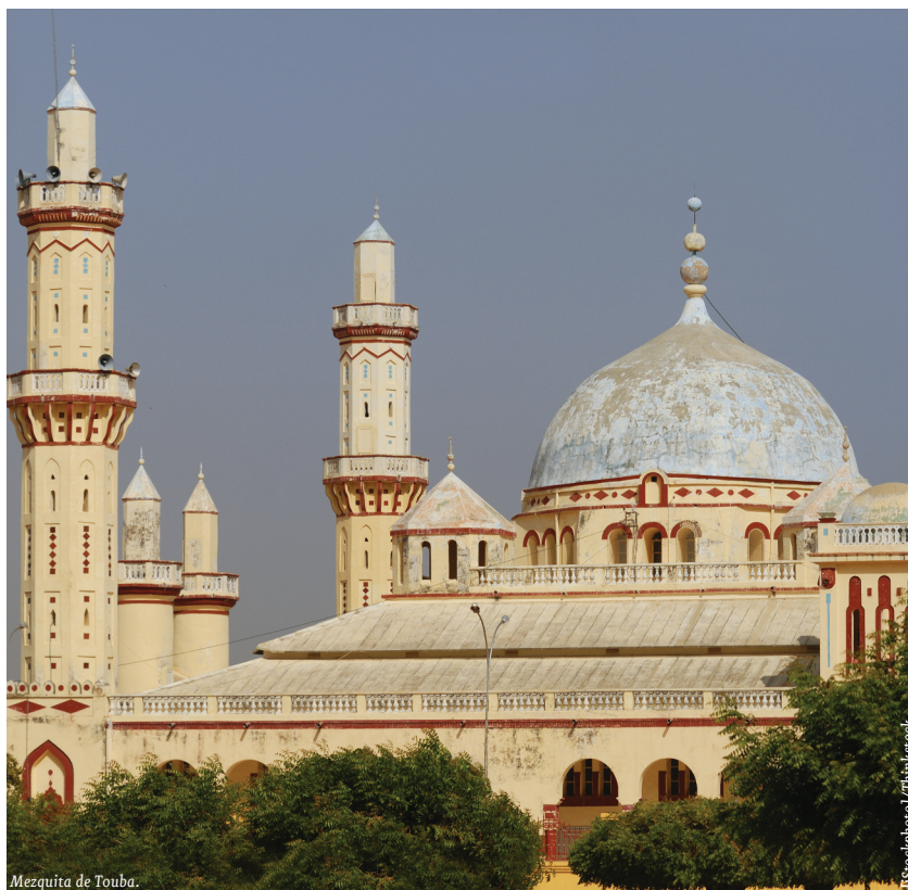
Mezquita de Touba.

La balanza comercial hispano-senegalesa tradicionalmente ha arrojado un saldo positivo para España, que, en los 10 primeros meses de 2011, ascendió a 61,53 millones de euros. En este período, el valor de las exportaciones españolas se situó en 131 millones de euros, el mismo valor que el alcanzado a lo largo de todo el ejercicio 2010. Las principales partidas de exportación fueron combustibles y aceites minerales (32,85%), máquinas y aparatos mecánicos (8,60%) y materias plásticas y sus manufacturas (5,20%).