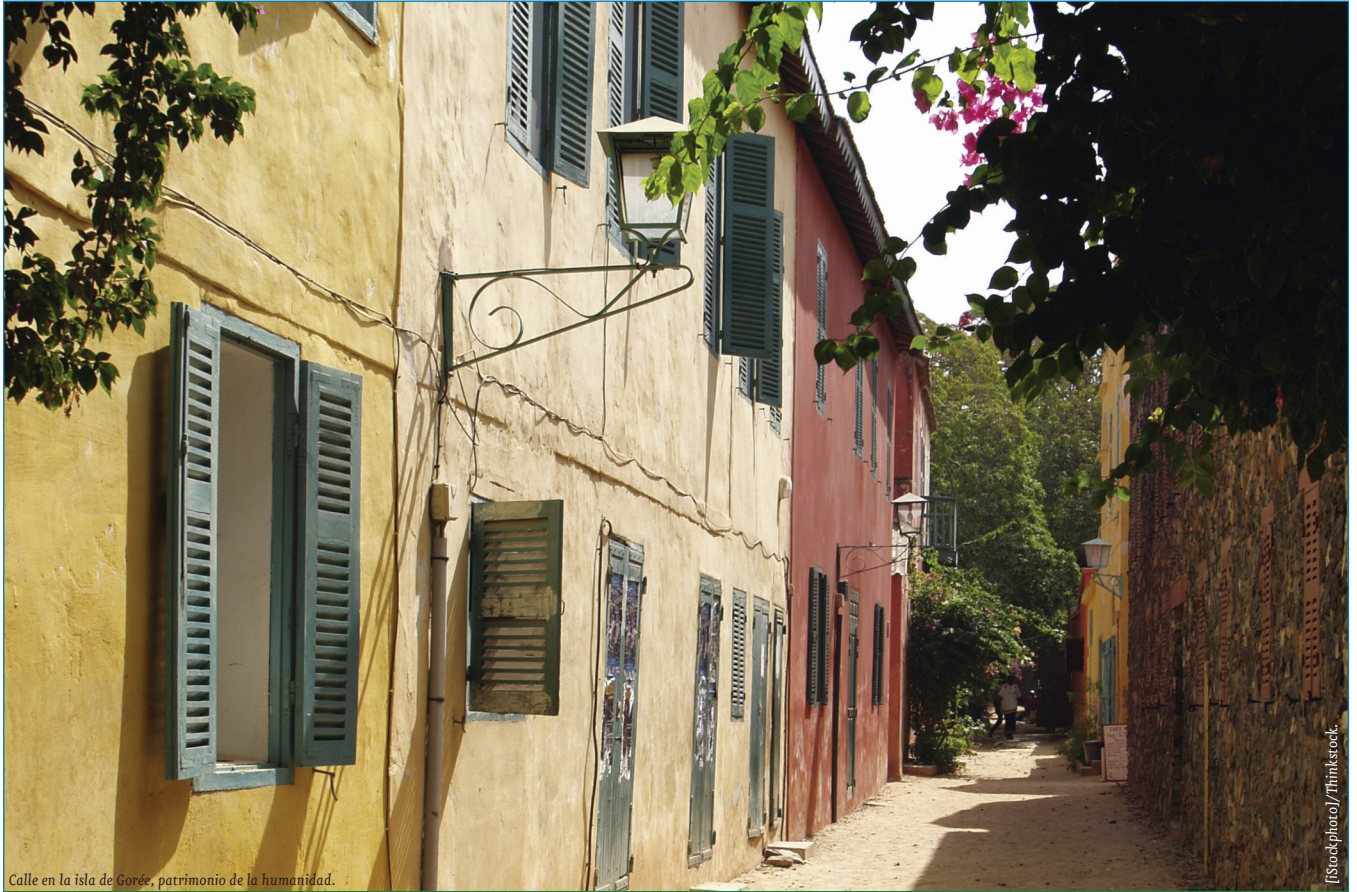
Calle en la isla de Gorée, patrimonio de la humanidad.