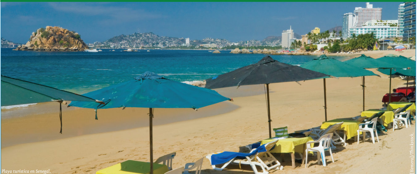
Playa turística en Senegal.