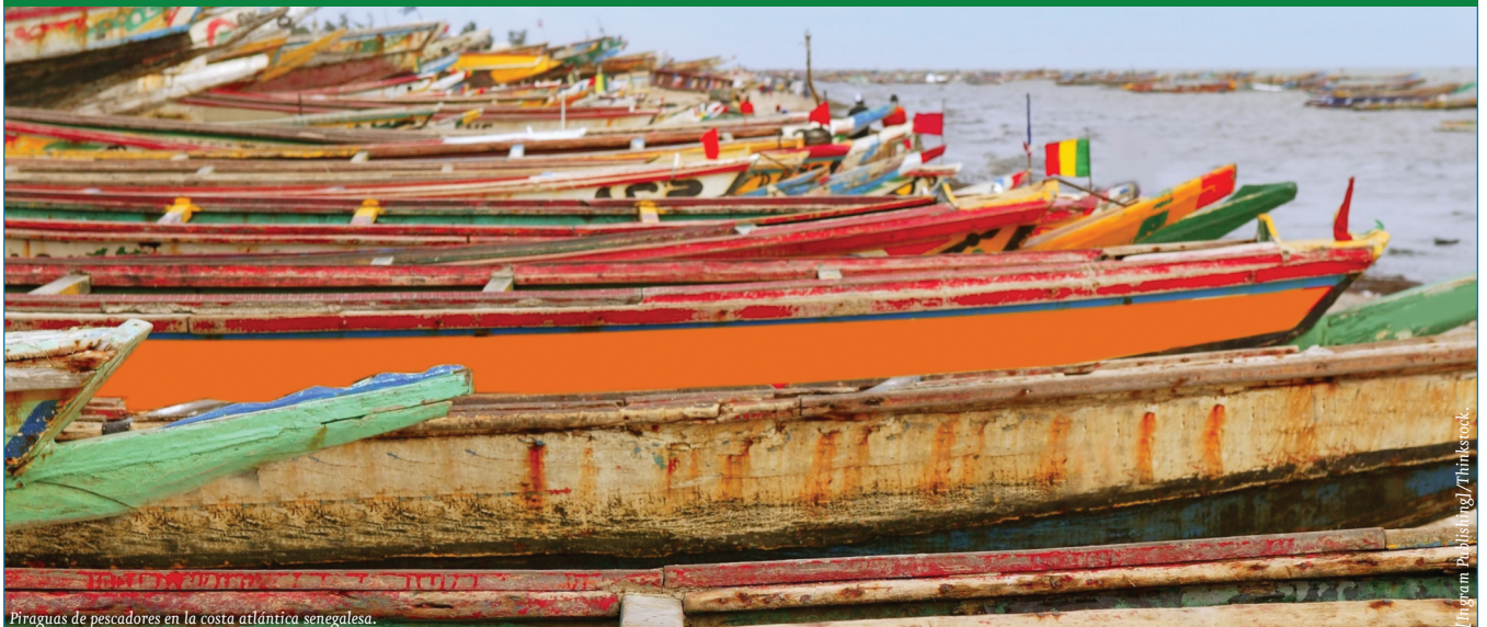
Piraguas de pescadores en la costa atlántica senegalesa.