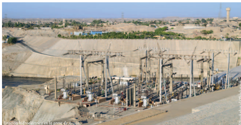
Estación hidroeléctrica en la presa de Asuan.

En cuanto a la composición tradicional, por productos, de dichas exportaciones, destacan la maquina-