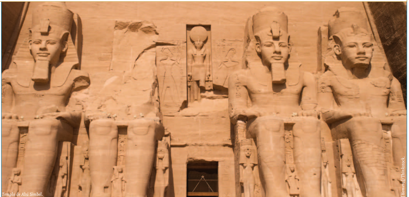
Templo de Abú Simbel.