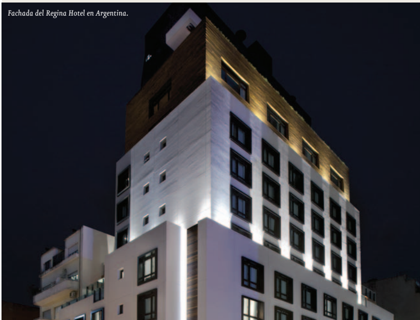
Fachada del Regina Hotel en Argentina.

El nuevo hotel se ubica en el barrio Microcentro de Buenos Aires y consta de 13 plantas con 104 habitaciones. La inversión total del proyecto asciende a cerca de ocho millones de euros y se estima que supondrá la creación de 40 nuevos puestos de trabajo. El proyecto cuenta con financiación de Cofides por importe de dos millones de euros con el objeto de financiar parte de la construcción y puesta en marcha del hotel. El 25% de este importe se ha desembolsado con cargo a recursos propios de Cofides y el 75% restante con cargo a recursos del FONPYME.