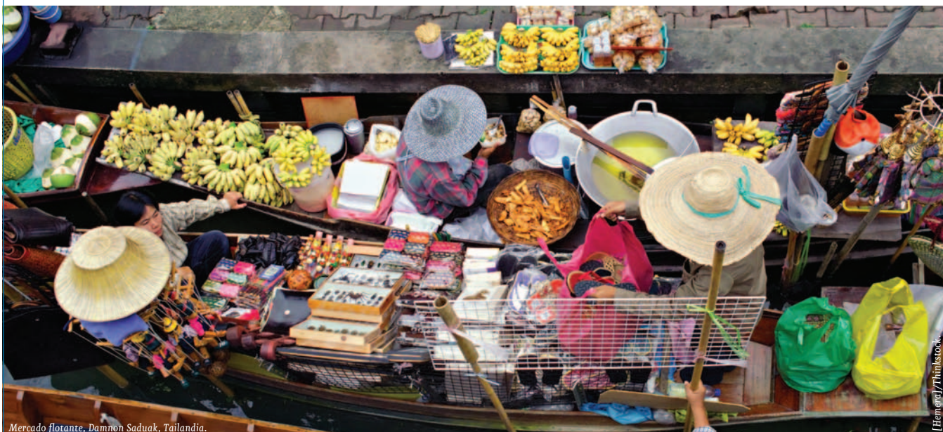
Mercado flotante, Damnon Saduak, Tailandia.