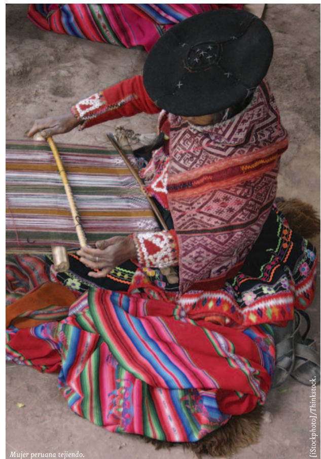
Mujer peruana tejiendo.

Otro grupo de operaciones, en este caso con instituciones financieras internacionales (IFI) de desarrollo, contemplan la financiación de aportaciones a (i) fondos constituidos en ellas destinados a la satisfacción de las necesidades sociales básicas en países en desarrollo, en las áreas de salud, educación, acceso al agua potable y saneamiento, género, agricultura, desarrollo rural, seguridad alimentaria, sostenibilidad ambiental y cambio climático; (ii) programas y fondos para la evaluación del