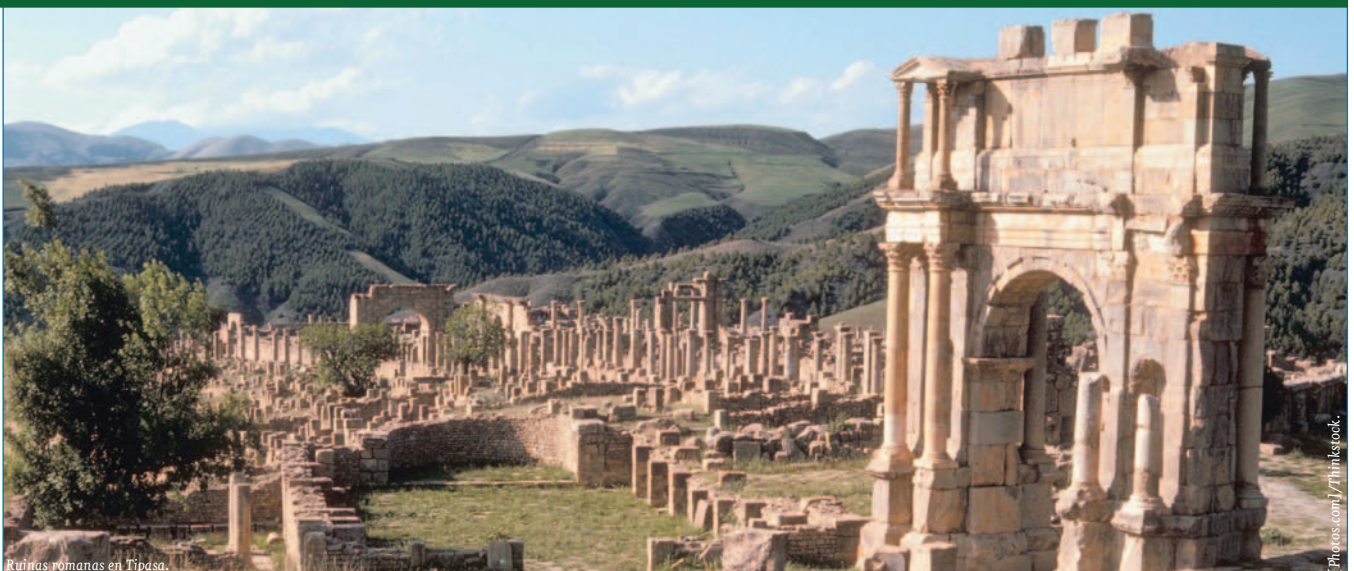
Ruinas romanas en Tipasa.