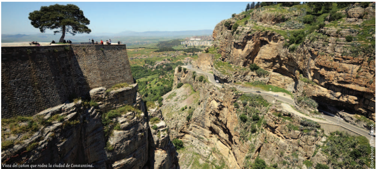
Vista del cañon que rodea la ciudad de Constantina.

En lo que se refiere a su situación política, Argelia es un país independiente desde 1962. En 1989 la nueva constitución instauró el multipartidismo. Tras años de aislamiento internacional, causado por una inestabilidad interna muy grande, los últimos han sido años de mayor estabilidad política como consecuencia del retroceso de la amenaza terrorista que dio lugar a una apertura hacia el exterior basada en las alianzas con países occidentales en contra del terrorismo internacional. Sin embargo, debido al aumento de la inflación, del desempleo, la falta de oportunidades para los jóvenes y la poca eficacia de las medidas sociales y económicas emprendidas, el país se ha visto contagiado por las revueltas sociales acaecidas en otros países árabes este