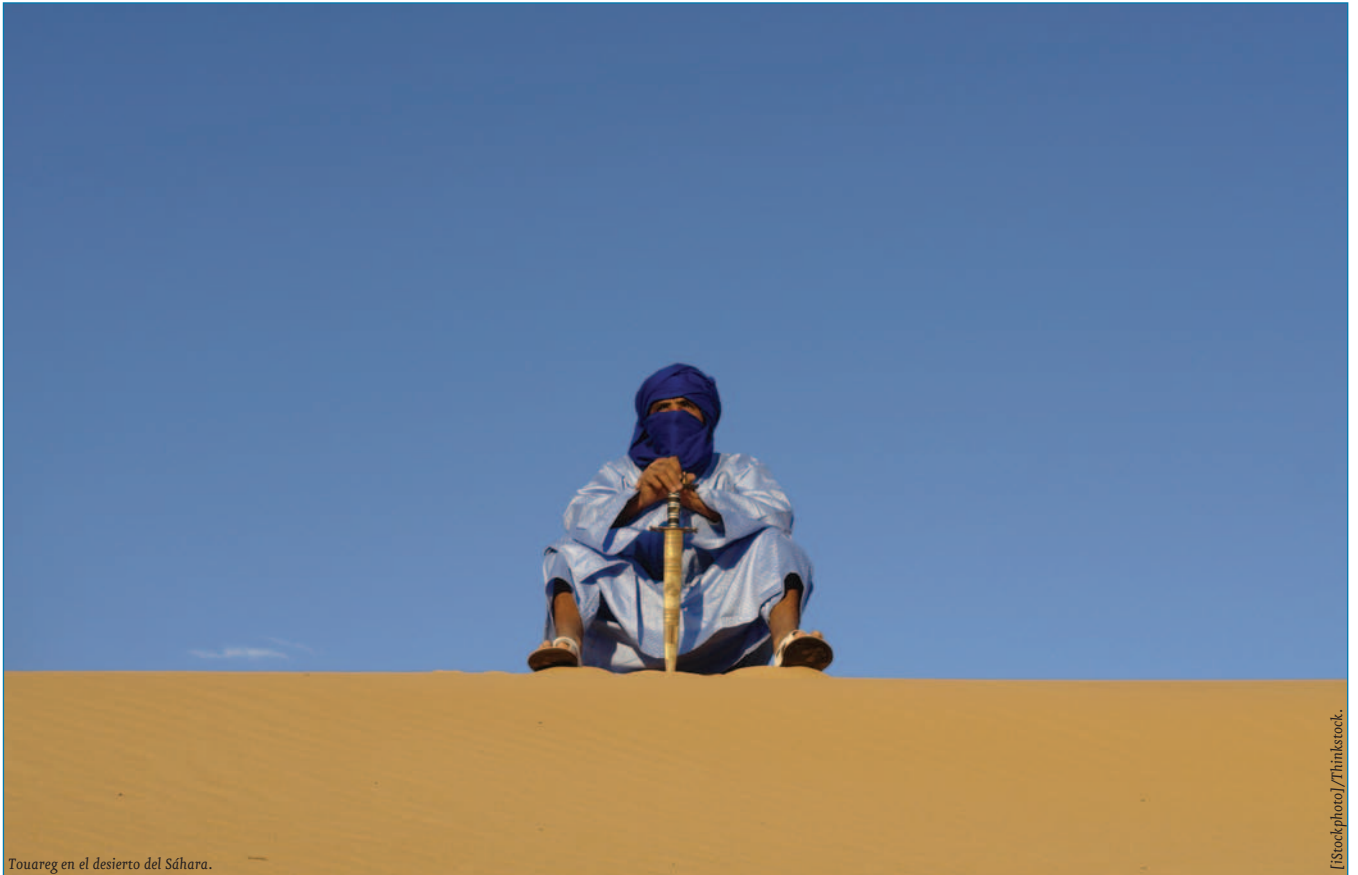
Touareg en el desierto del Sáhara.