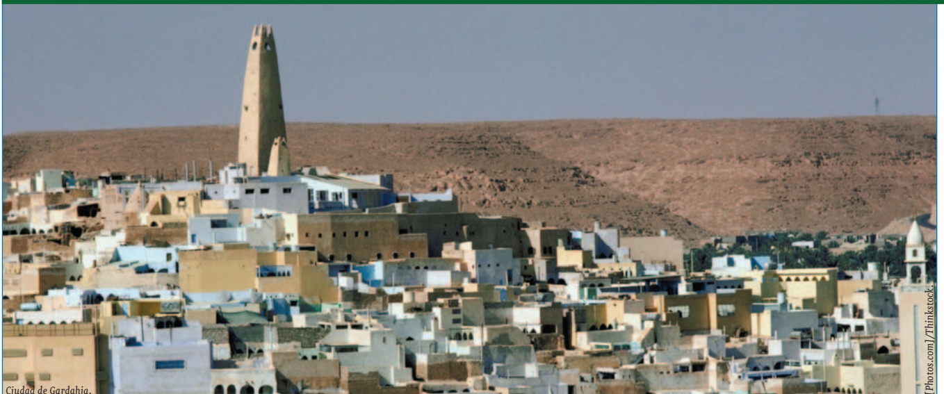
Ciudad de Ghardaia.