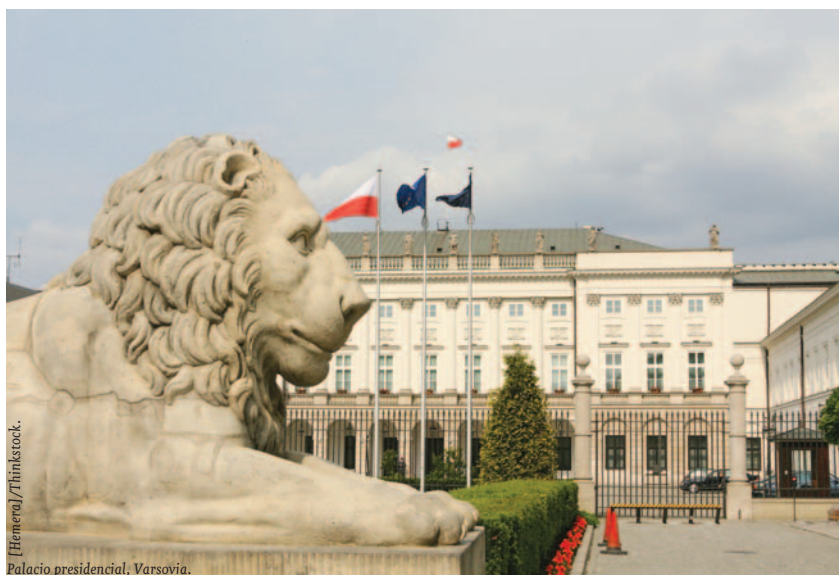
Palacio presidencial, Varsovia.

En el último lustro (excepto en 2008), la balanza comercial hispano-polaca ha sido deficitaria para España arrojando un saldo negativo de 260 millones de euros en 2010 y esto a pesar de la tendencia en general positiva registrada por las exportaciones españolas hacia Polonia, las cuales han verificado un crecimiento interanual algo superior al 13% en dicho período de referencia alcanzando los 2.784 millones de euros el año pasado. Los principales capítulos exportados por España a Polonia durante 2010 fueron vehículos automóviles (16,76% del total), frutas y frutos sin conservar (9,75%), máquinas y aparatos mecánicos (8,25%) y aparatos y material eléctricos (6,34%). Mientras, entre las mercancías importa-