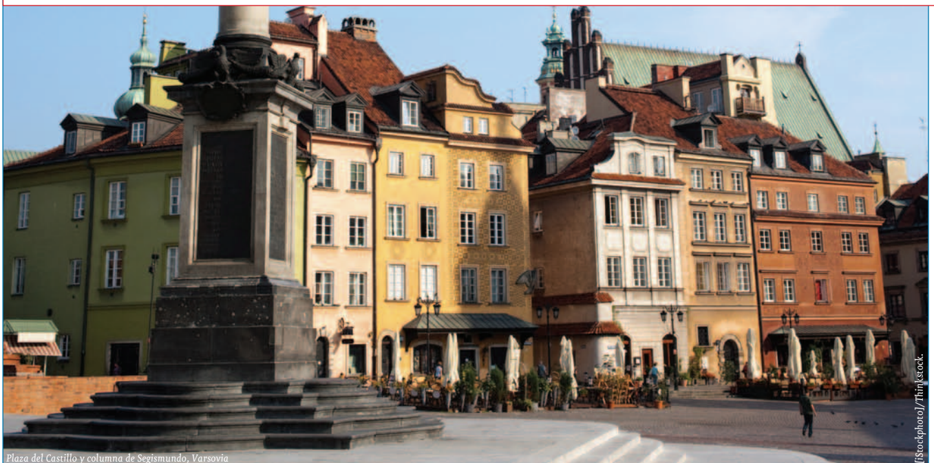
Plaza del Castillo y columna de Segismundo, Varsovia