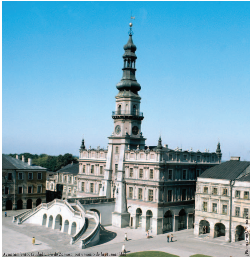
Ayuntamiento, Ciudad vieja de Zamosc, patrimonio de la Humanidad.

Con todo, las potenciales oportunidades de negocio para la empresa española en este mercado vendrían dadas tanto por la vía de la inversión como de las exportaciones. Bajo la óptica de la inversión directa, entre las actividades económicas especialmente atractivas estarían las de construcción e ingeniería civil, las ligadas a las energías renovables y la gestión de residuos urbanos y agua. No hay que olvidar que Polonia presenta todavía importantes carencias en su dotación de infraestructuras, circunstancia que conlleva la recepción de un destacado volumen de fondos comunitarios y el desarrollo de importantes proyectos tendentes