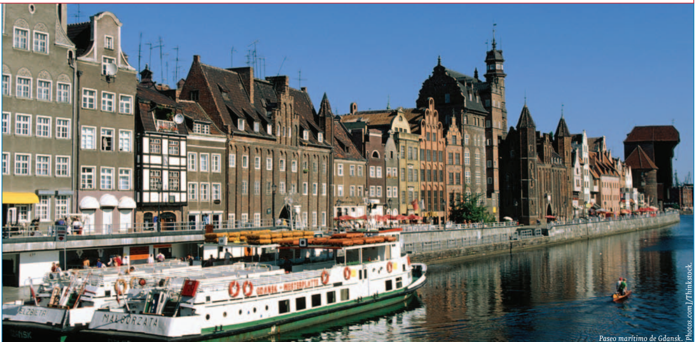
Paseo marítimo de Gdansk.