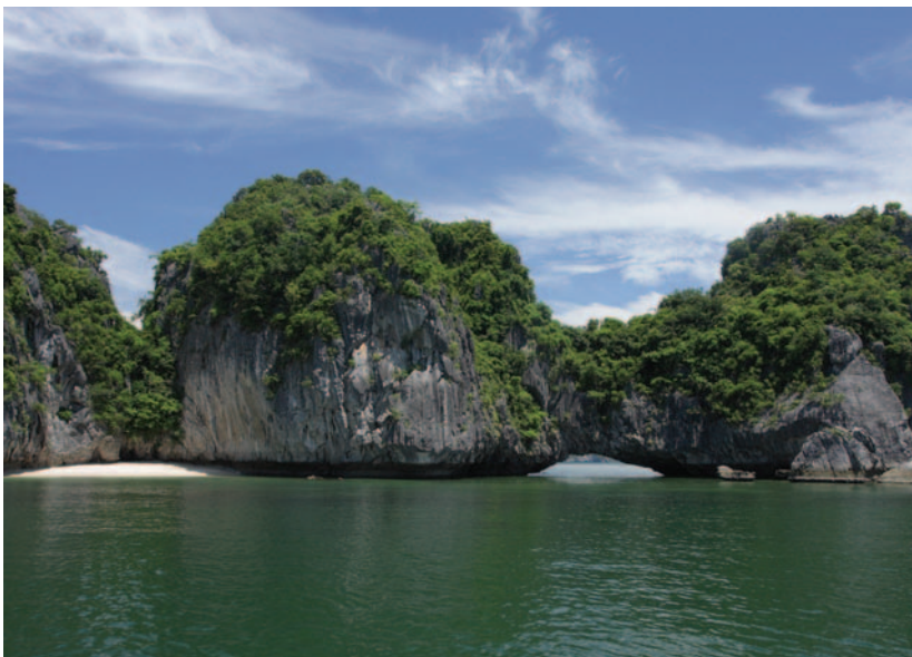
Isla en la bahía de Ha Long, provincia de Quang Ninh.