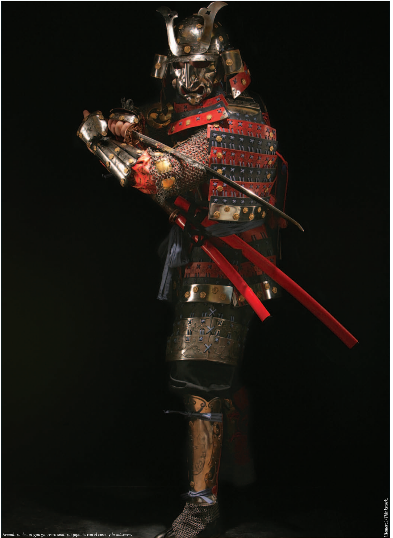
Armadura de antiguo guerrero samurai japonés con el casco y la máscara.