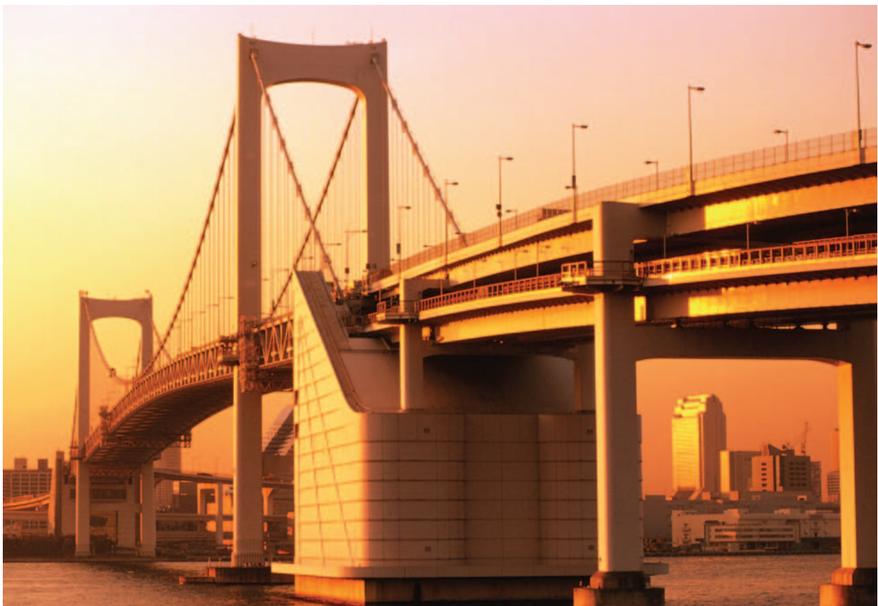
Puente Arco iris sobre la bahía de Tokio.

La tasa de envejecimiento de la población -la más alta del mundo-, junto con la muy oriental capacidad de ahorro y espera (paciencia) de los japoneses, retroalimentan las presiones deflacionistas por diferimiento del consumo del presente al futuro. La población joven, en franco retroceso, fruto de las políticas de natalidad de los años sesenta a ochenta, deberá sustentar en un futuro muy cercano la carga de una pirámide poblacional invertida. Fijémonos en cómo resuelven este trascendental problema, que tiene visos de similitud con lo que ya está ocurriendo en la «vieja» Europa ::