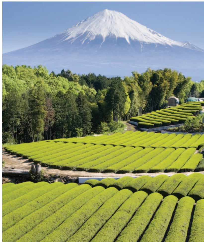
Cultivo de té verde y Monte Fuji al fondo.

proveedor de ese continente. Actualmente, el 1,5% de las importaciones españolas provienen de Japón, mientras que el 8,04% proviene de China.