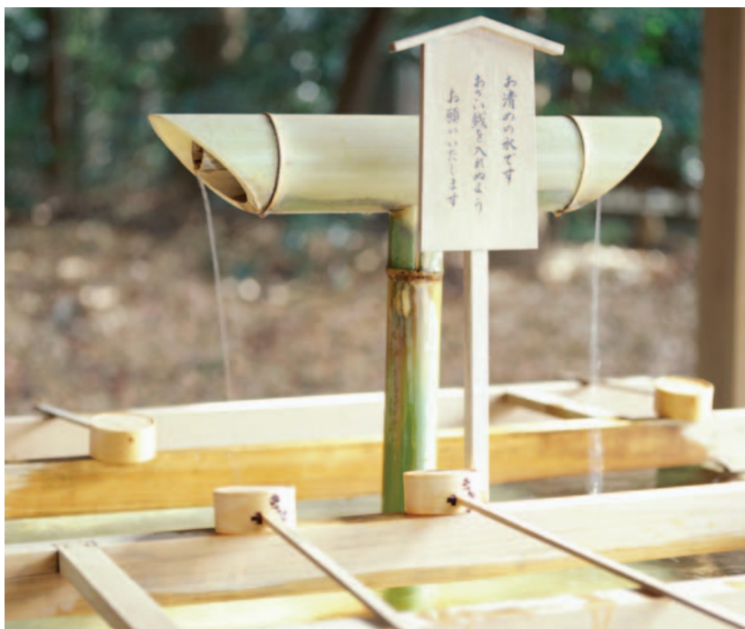
Área de limpieza y purificación del agua en el santuario Meiji de Tokio.

Como ocurre con las economías más desarrolladas, Japón se caracteriza por un predominante sector servicios que representa casi las tres cuartas partes del PIB. El resto, fundamentalmente, corresponde al sector industrial, de gran dimensión en términos absolutos y con un alto reconocimiento internacional por la relevancia de algunos de sus más importantes conglomerados en el sector de la automoción, maquinaria de transporte, herramienta y robótica, maquinaria eléctrica,