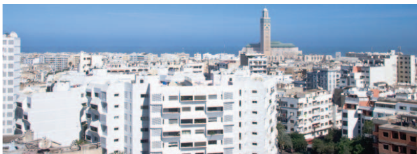
Vista de Casablanca con la mezquita Hassan II al fondo.

Sin embargo, en ámbitos como el energético, que reviste un importante crecimiento de la demanda, Marruecos depende en un 90% de las importaciones. Por esto, el Gobierno marroquí trata de impulsar la creación de grandes plantas de energía solar y eólica, que disminuyan dicha dependencia un 20% en 2015.