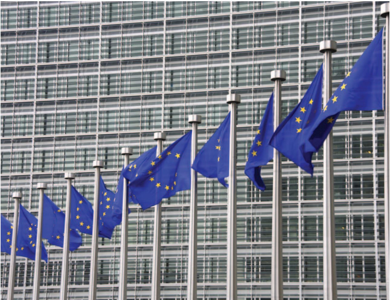
Sede del Parlamento Europeo en Estrasburgo.