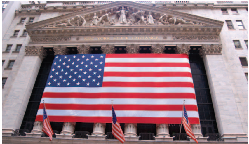
Bolsa de Nueva York.

la prohibición de que los bancos arriesguen operaciones comerciales por cuenta propia, la obligatoriedad de que las entidades bancarias informen a los supervisores de las actividades que lleven a cabo en el mercado de derivados y la limitación al 3% de las inversiones de los bancos en los fondos de alto riesgo y en los fondos de capital-riesgo. La ley también establece medidas de protección de los consumidores. La reforma dará más poderes a la SEC (Securities and Exchange Comisión, cuya misión es proteger a los inversionistas y mantener la integridad de los mercados de valores) y a la Comisión de Fondos de Materias Primas.