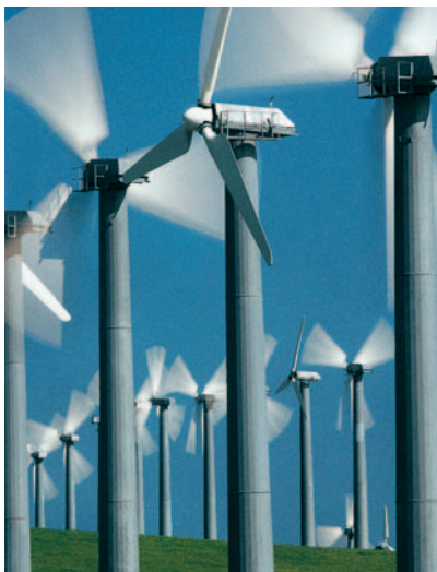
Turbinas de energía eólica, Tracy, California, EEUU

AAA, AA(+,-), A(+,-), BBB(+,-), BB(+,-), B(+,-), CCC(+,-), CC, C, "NR": not publicly rated